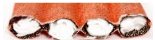
4-canali-imbracature di sollevamento