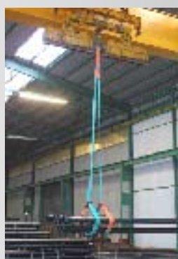
Le imbracature di sollevamento Duplix