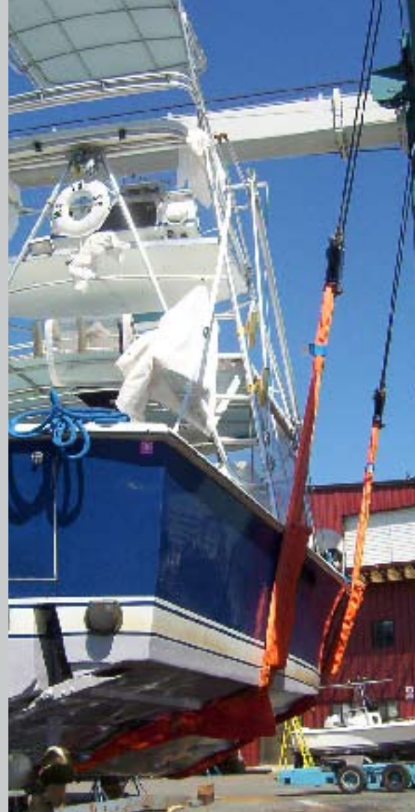
Le imbracature di sollevamento Duplix per barche