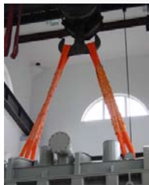
Élingue de levage DUPLIX